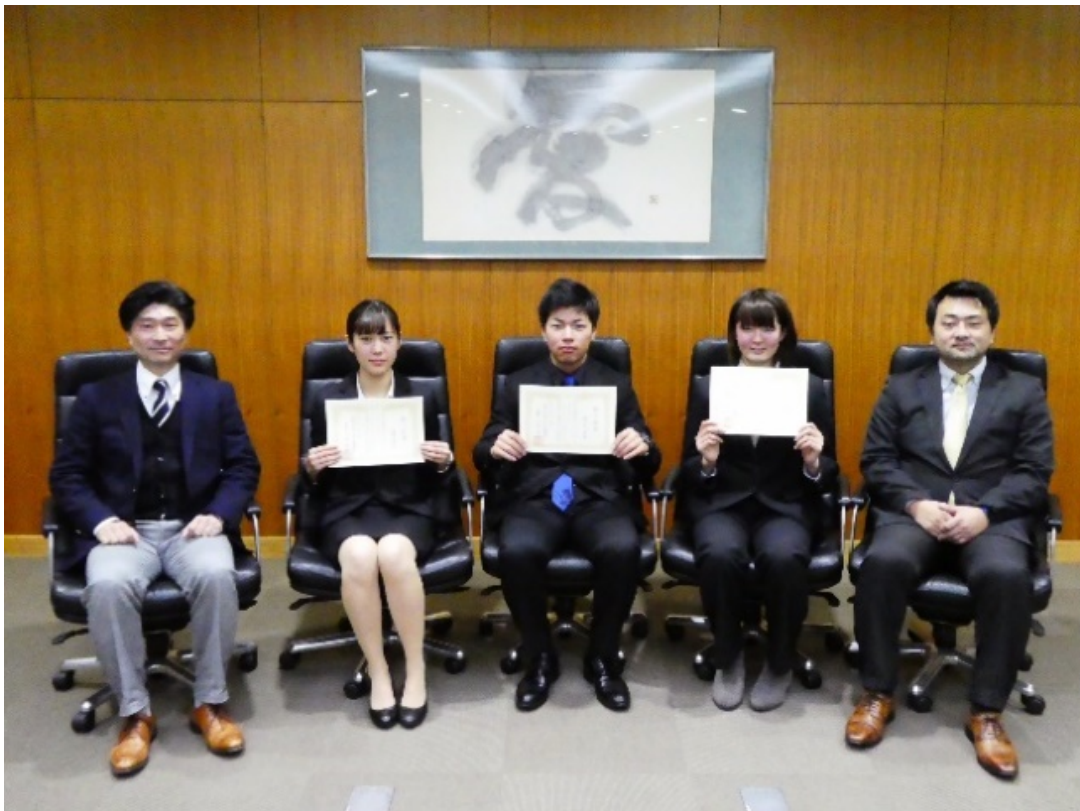
愛媛大学リーダースクールでの活動

環建の授業はコマ数やテストが多くて大変とよくいわれますが，学科のみんなと協力する分，結束が固まるし，他の活動との両立も十分可能だと思っています。