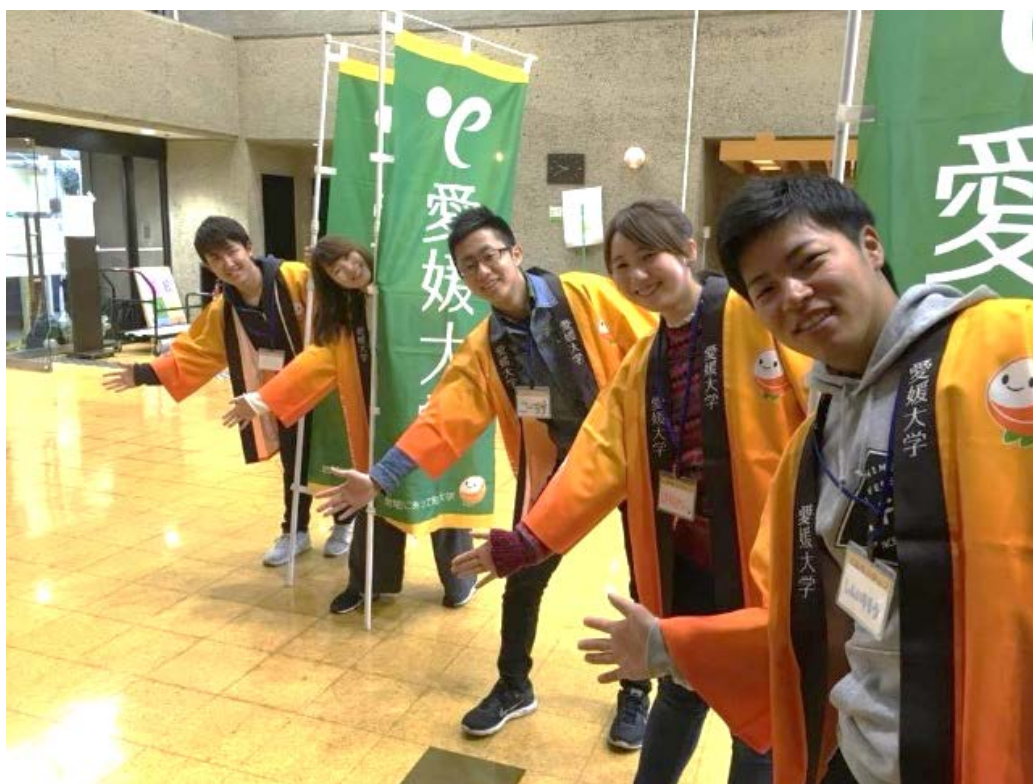
愛媛大学リーダーズスクールでの活動

200 単位以上を取得して卒業することを勝手に目標に掲げて，他学部で開講されている講義の履修なども積極的に行っています。環建の授業ももちろん楽しいですが，文系視点でのまちづくりを学べる社会共創や法文学部の授業も面白いです。正課外活動である授業，愛媛大学リーダーズスクールやアーバンデザインスクールまつやまに参加しての講義も新しい刺激をもらえて楽しいです。