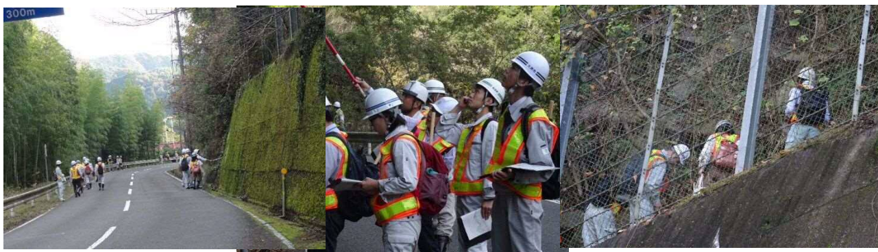
③④⑤斜面のフィールドワーク 道路のり面の観察、記録、検討