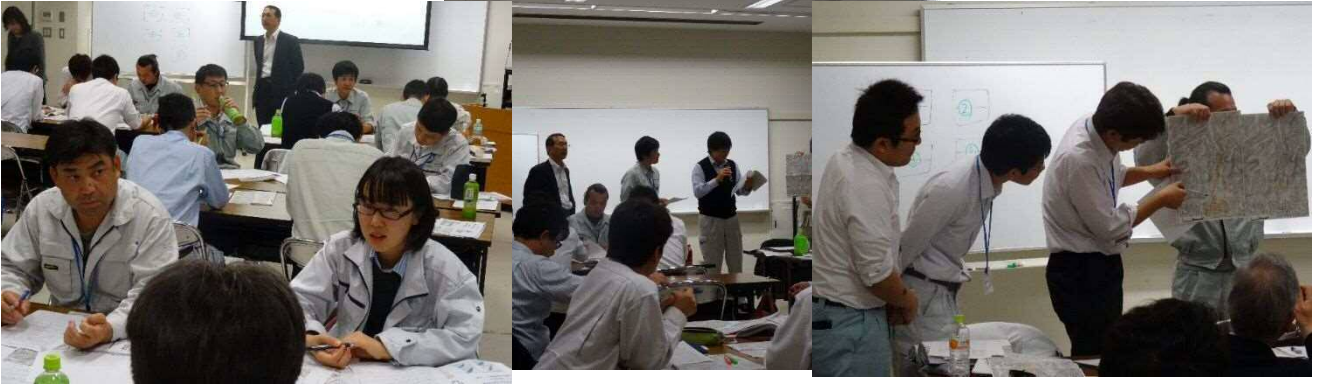
④土砂災害の演習 グループ討議及び発表

11 月 20 日 ①地震発生による被害と対策、②③津波発生と被害想定及び演習、④閉講式