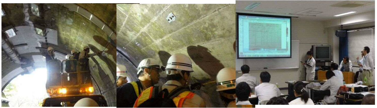
③④⑤トンネルのフィールドワーク トンネル近接目視 トンネル成果発表

11 月 16 日 ①②擁壁の設計と維持管理及び演習、③④⑤斜面のフィールドワーク