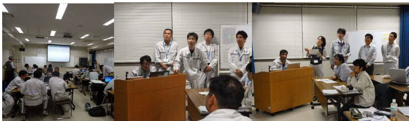
③④⑤フィールドワーク 調査結果取りまとめ・成果発表