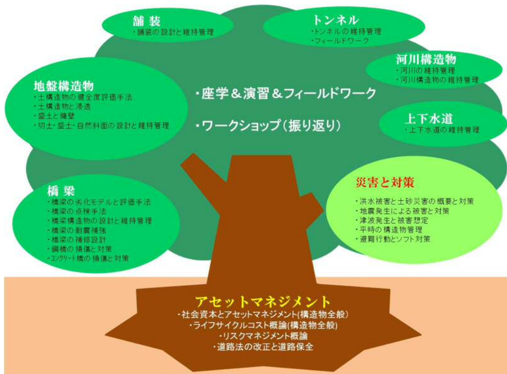
図 1. 社会基盤メンテナンスエキスパート養成講座科目構成関係イメージ図.

図 1 にあるように、本講座では、アセットマネジメントは社会基盤の維持管理を行う上で根幹になるものである。ライフサイクルコスト (LCC)、リスクマネジメントの考えを含め、アセット (資産) を管理する考えは、例えば、橋梁、トンネルといった具体の構造物を維持管理する上において共通の基本的な手法である。