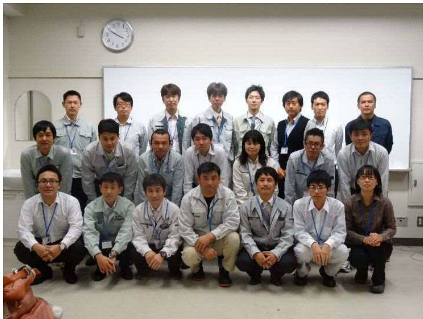
平成 27 年度ME養成講座の修了生 22 名