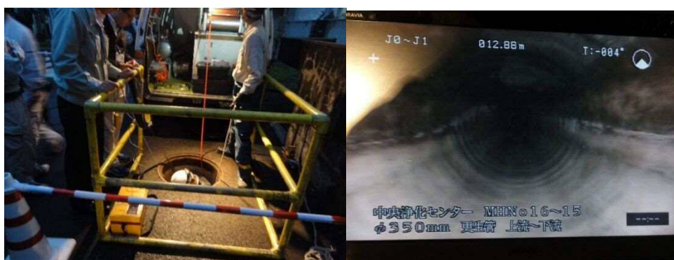
⑤下水道の維持管理 カメラによる撮影