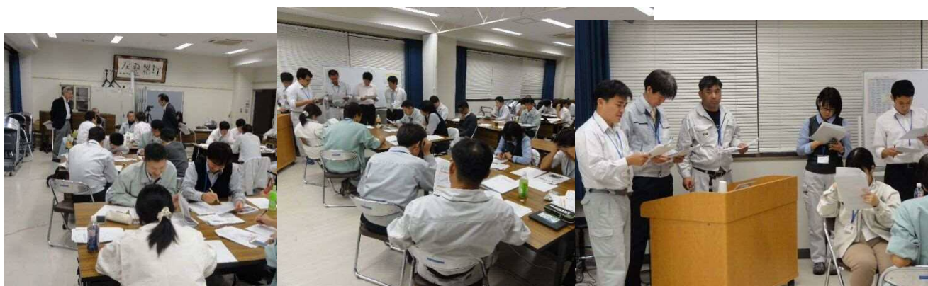
③④⑤ 演習問題検討及び結果発表、意見交換

11 月 18 日 ①②河川及び河川構造物の維持管理、③補強土、④下水道の維持管理、 ⑤下水道実習