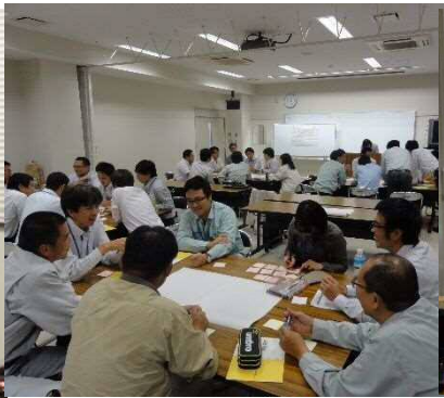
⑤ワークショップ 4 回目