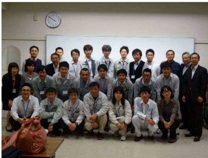
平成 27 年度ME養成講座修了生 22 名と事務局