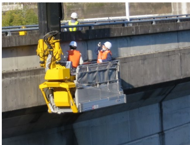
設計のための現地調査中

大学で学んだことを活かし、生まれ育った地元 に貢献できる会社で働きたいという思いから、今 の仕事への就職を決めました。